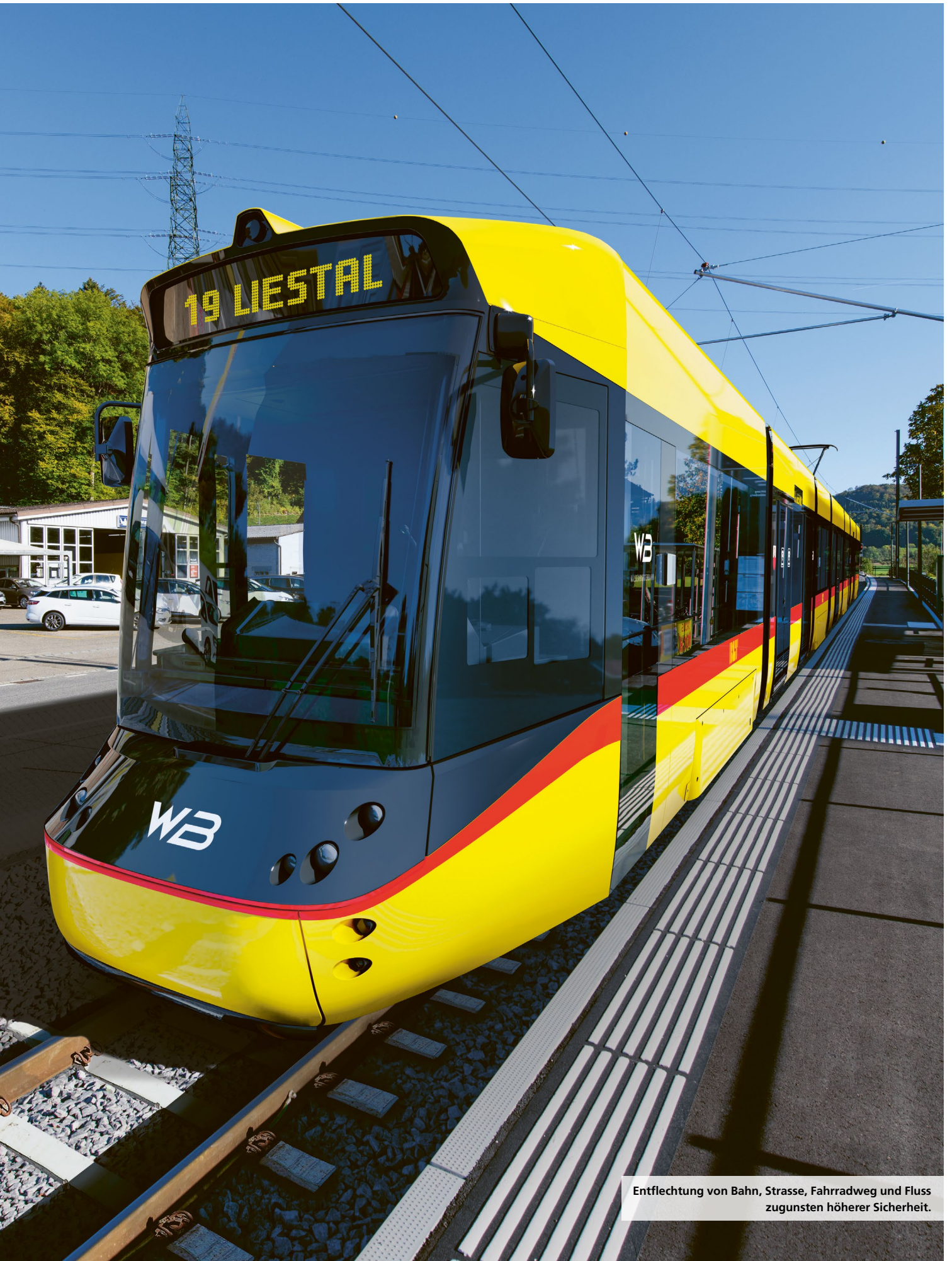
Entflechtung von Bahn, Strasse, Fahrradweg und Fluss zugunsten höherer Sicherheit.