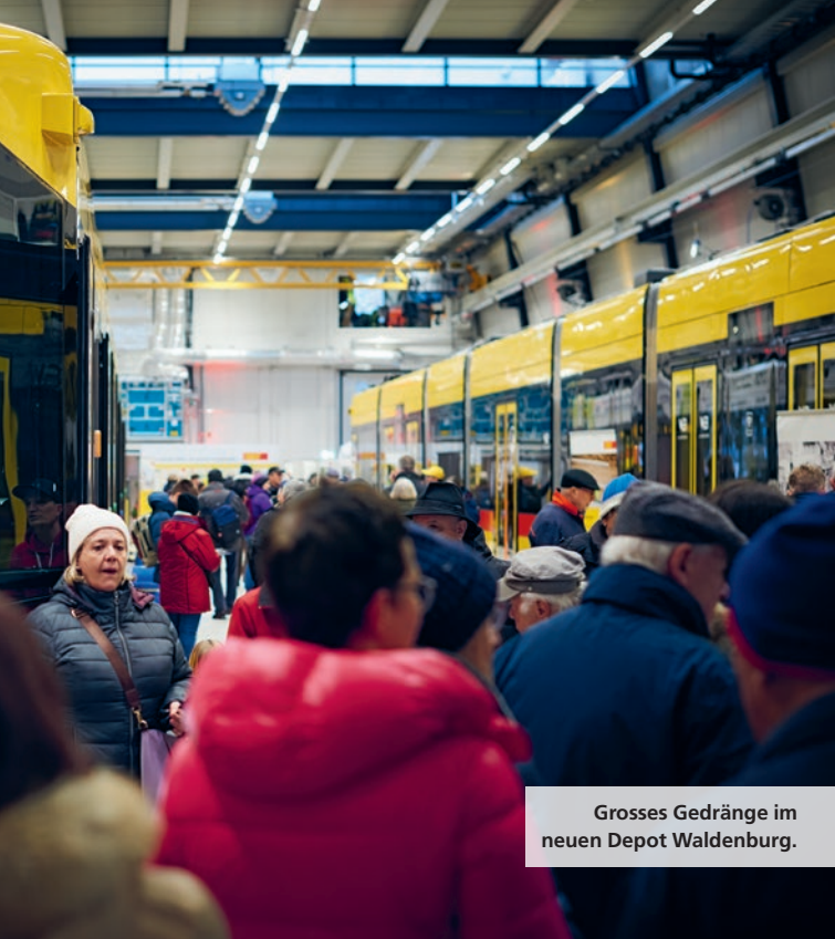
Grosses Gedränge im neuen Depot Waldenburg.