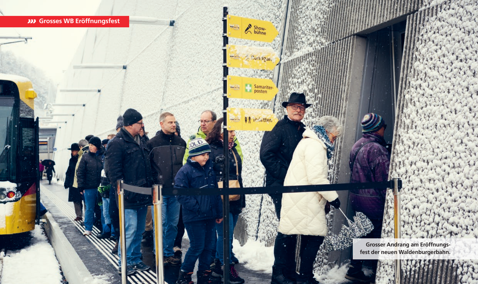
Grosser Andrang am Eröffnungsfest der neuen Waldenburgerbahn.