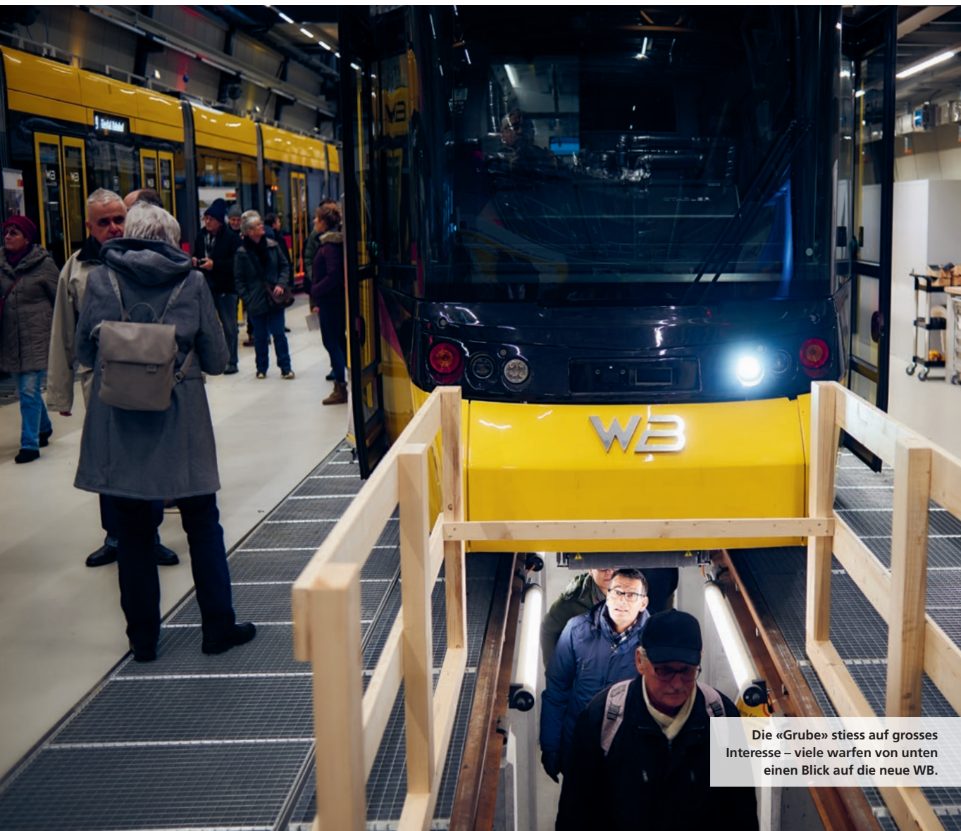
Die «Grube» stiess auf grosses Interesse – viele warfen von unten einen Blick auf die neue WB.