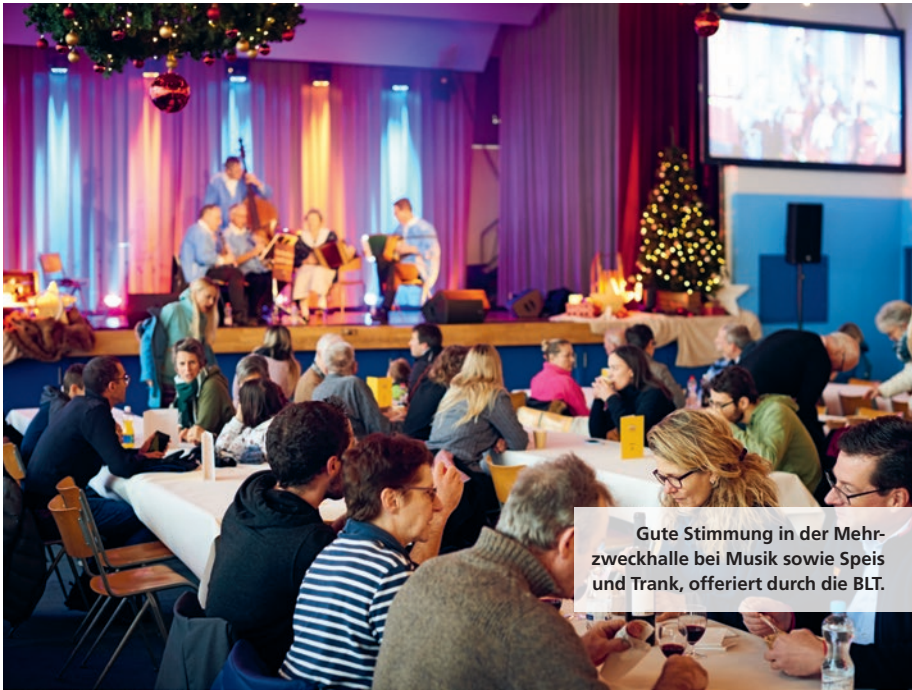
Gute Stimmung in der Mehrzweckhalle bei Musik sowie Speis und Trank, offeriert durch die BLT.