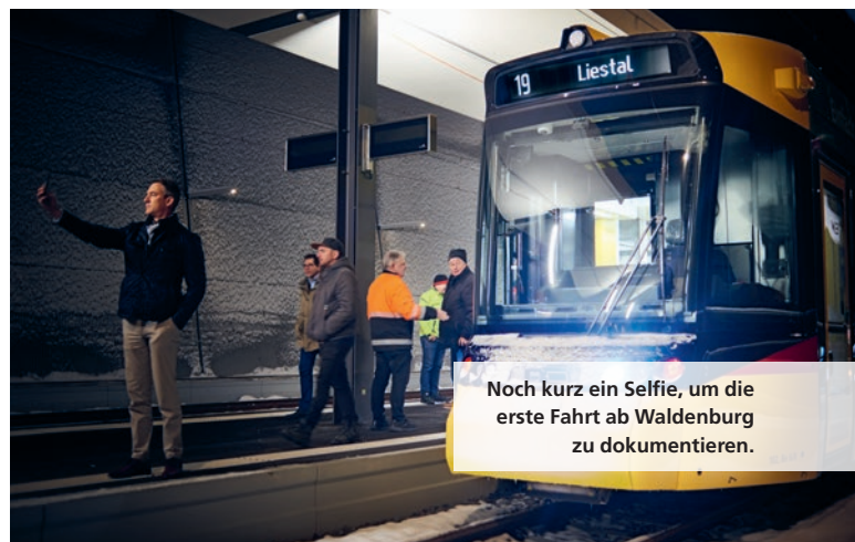
Noch kurz ein Selfie, um die erste Fahrt ab Waldenburg zu dokumentieren.