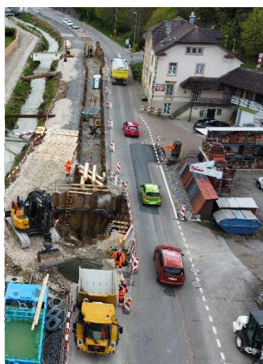
Ampel im Bereich Kanalisation Hauptstrasse